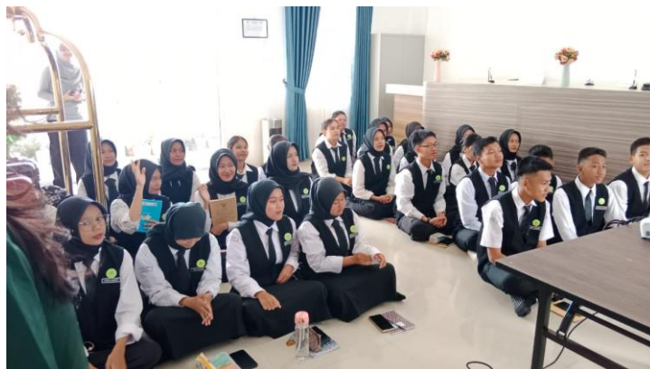
Gambar 2. Pelaksanaan kegiatan

mengindikasikan bahwa metode pelatihan yang diterapkan efektif dalam meningkatkan keterampilan siswa pada kedua aspek tersebut.