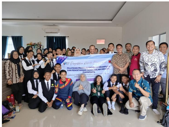
Gambar 1. Kegiatan pengabdian kepada masyarakat di SMKN 1 Bintang Utara

Program Pengabdian kepada Masyarakat (PKM) ini bertujuan untuk menjawab tantangan tersebut melalui pendekatan yang komprehensif dan terintegrasi. Dengan melibatkan dosen dan mahasiswa dari perguruan tinggi, pelatihan ini dirancang untuk memberikan pengalaman belajar yang praktis dan aplikatif, sehingga siswa dapat langsung menerapkan keterampilan yang diperoleh dalam konteks nyata (Lapotulo et al., 2023). Pendekatan ini diharapkan dapat meningkatkan tidak hanya keterampilan teknis siswa, tetapi juga kemampuan interpersonal yang sangat dibutuhkan dalam lingkungan kerja (Sholeh, 2023). Melalui kolaborasi ini, diharapkan SMKN 1 Bintang Utara dapat menghasilkan lulusan yang lebih siap dan kompetitif di dunia kerja, serta mampu beradaptasi dengan cepat terhadap perubahan yang terjadi di industri (Sulyati, 2022).