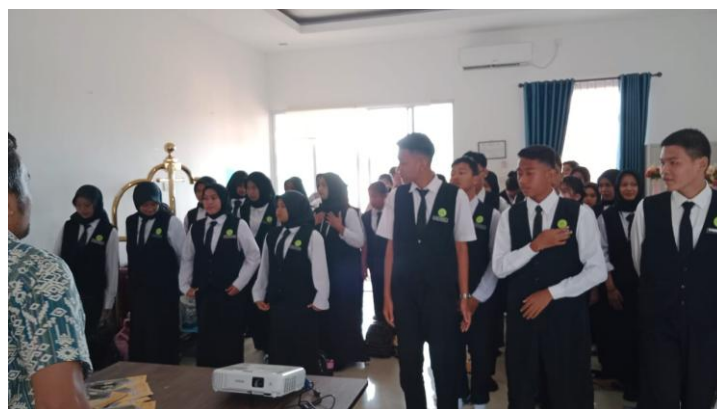
Gambar 3. Simulasi kegiatan

Umpan balik dari siswa menunjukkan bahwa mereka merasa lebih percaya diri dalam kemampuan mereka untuk merancang yang sesuai dengan standar industri. Siswa A menyatakan, "Mendesain tata amenities di kamar mandi membuat saya lebih memahami pentingnya kenyamanan bagi tamu." Siswa B menambahkan, "Proyek ini membantu saya melihat bagaimana setiap detail dapat mempengaruhi pengalaman tamu di hotel."